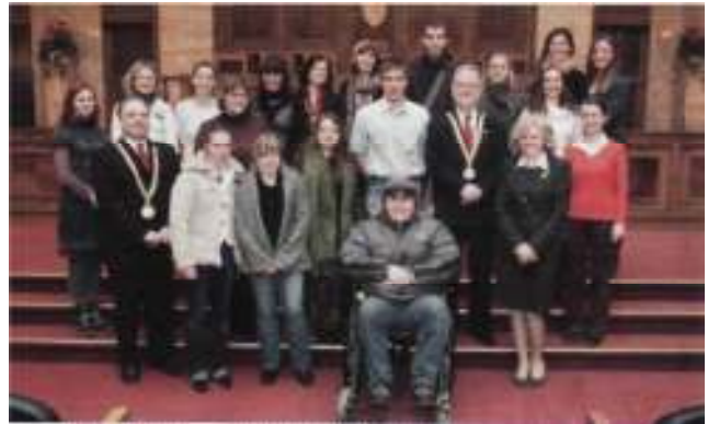
Zahraniční hostia zavítali aj na UK, kde sa stretli so zástupcami univerzity.