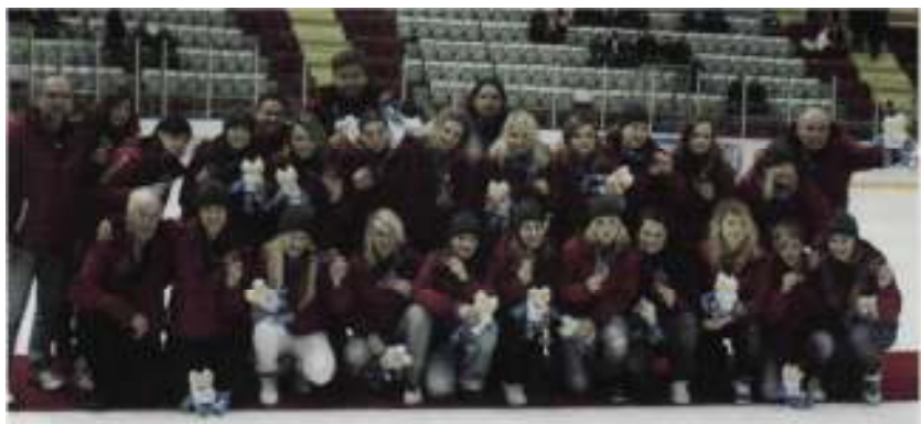
Družstvo žien v ľadovom hokeji s bronzovými medailami.